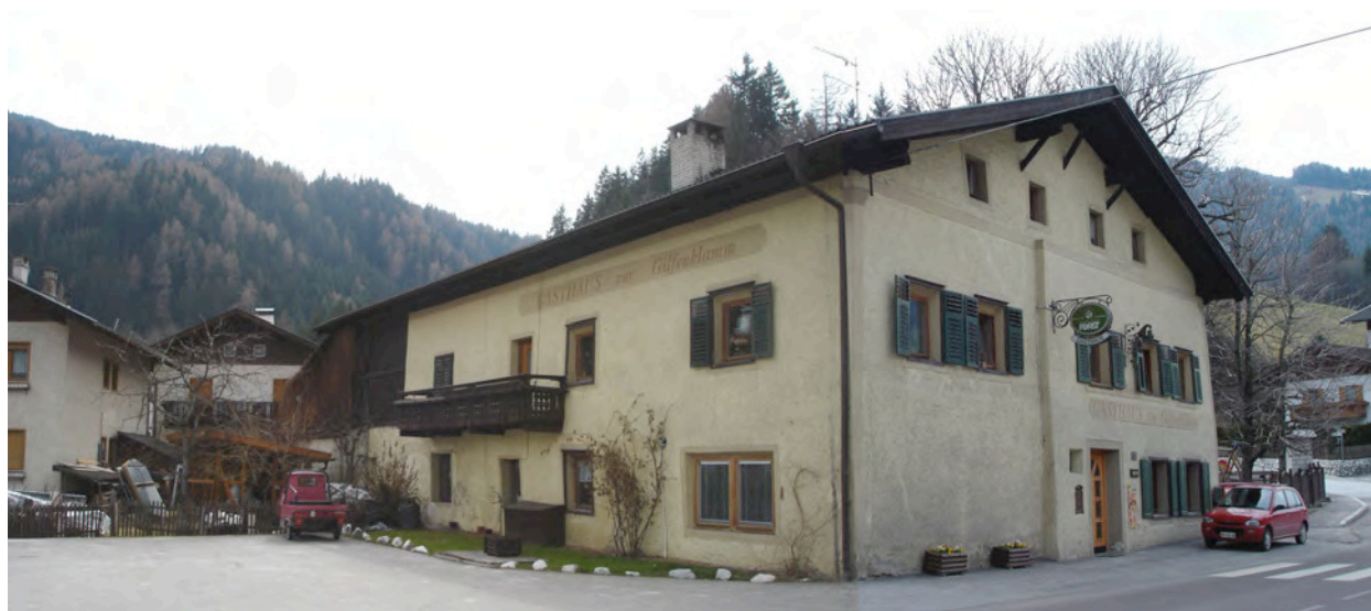
BP Ped 10/1 Ostansicht – Vista da Est