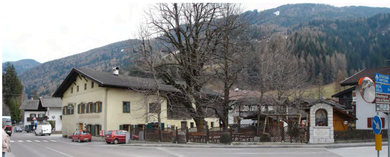
BP Ped 10/1 Nordansicht – Vista da Nord