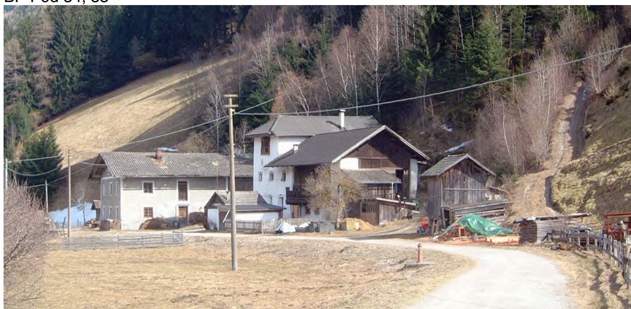
Westansicht – Vista da Ovest