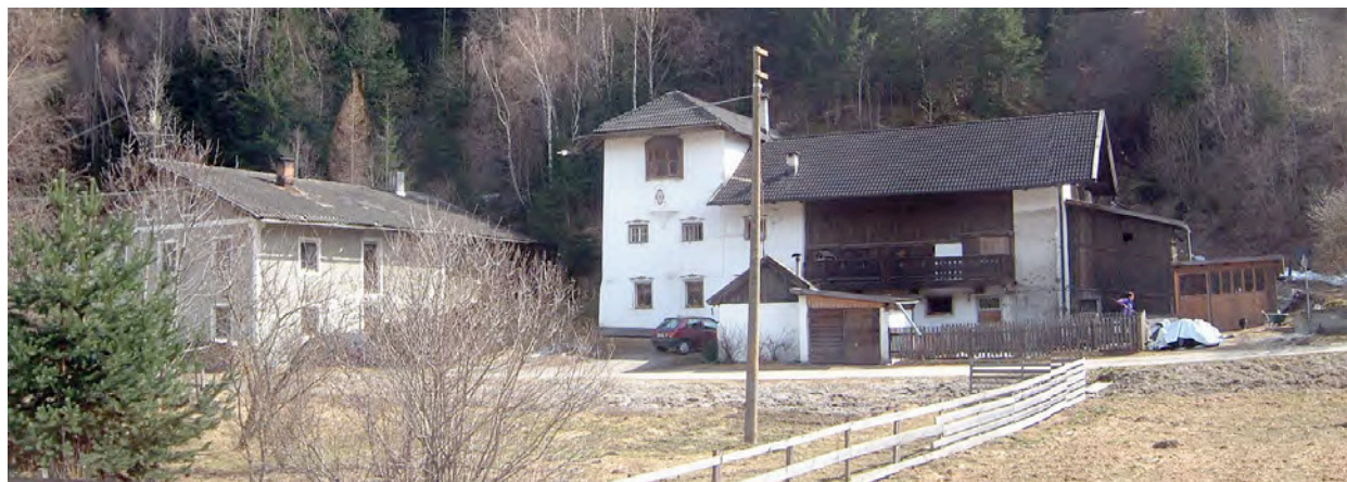
BP Ped 34, 33