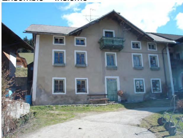
BP Ped 88 Links – a sinistra