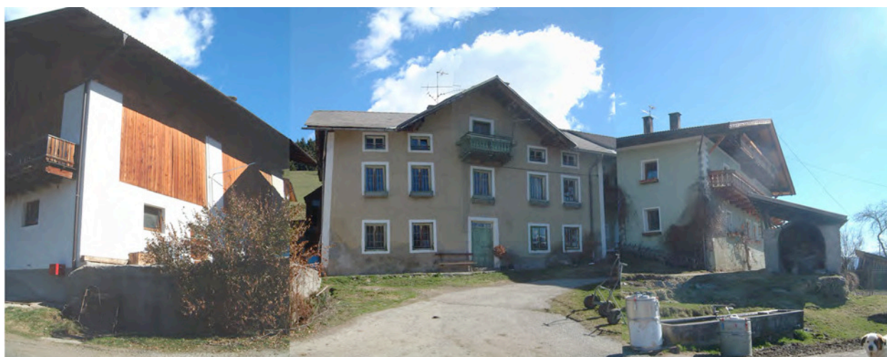
Ensemble – Insieme