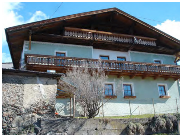
BP Ped 88 Rechts – a destra