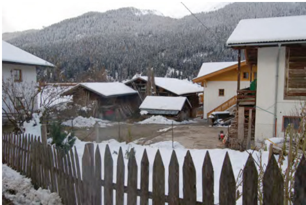
BP Ped 52