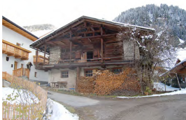
BP Ped 60/1