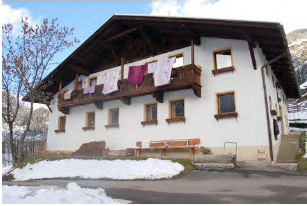
BP Ped 57 Sud