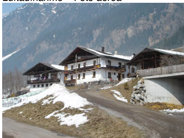
BP 58, 59/1,60/1 - 2006