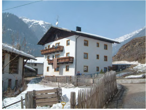
BP Ped 55