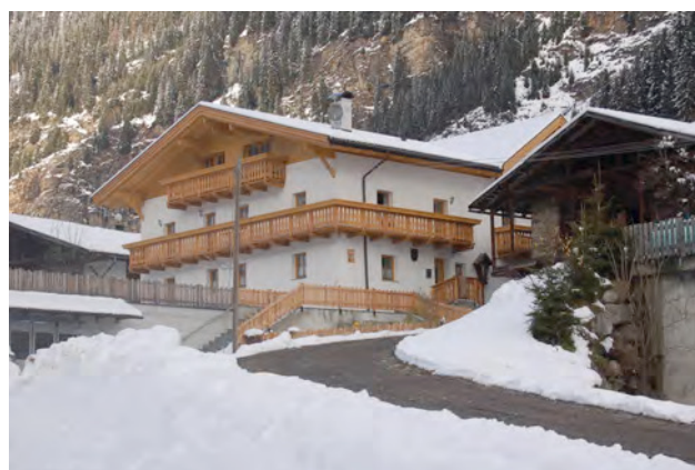
BP Ped 59/1, 60/1 2010