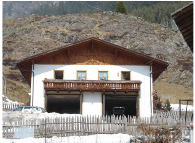
BP Ped 321