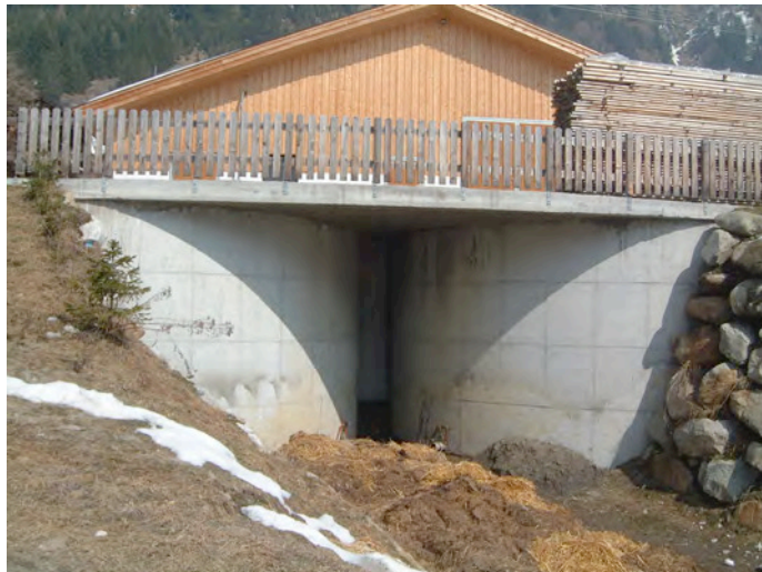
GP PF 723