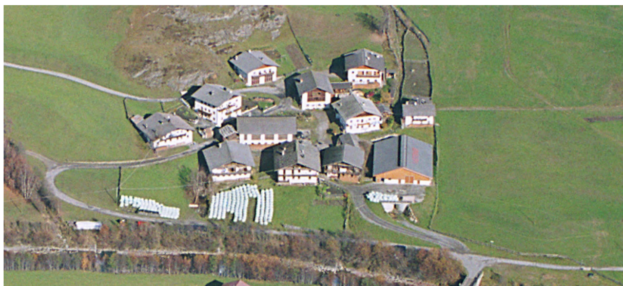
Luftaufnahme – Foto aerea