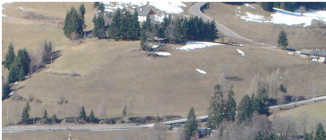
Ostansicht – Vista da Est