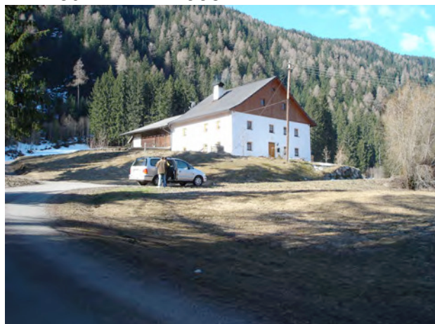
BP Ped 14