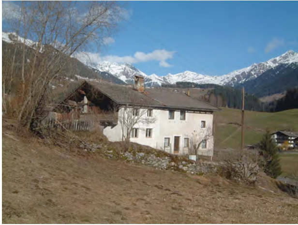
BP Ped 17/1 2006