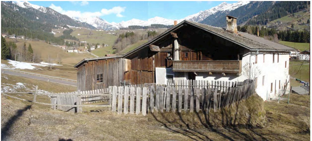
BP Ped 17/1 Westansicht – Vista da Ovest