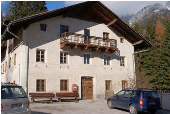
BP Ped 11/1