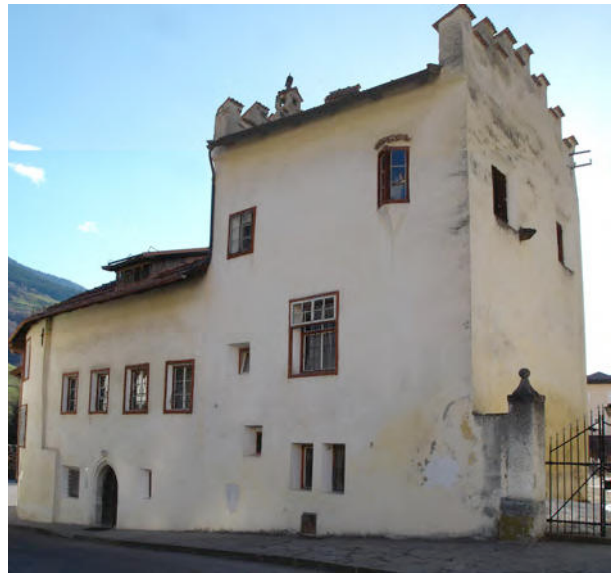
BP Ped 2/1