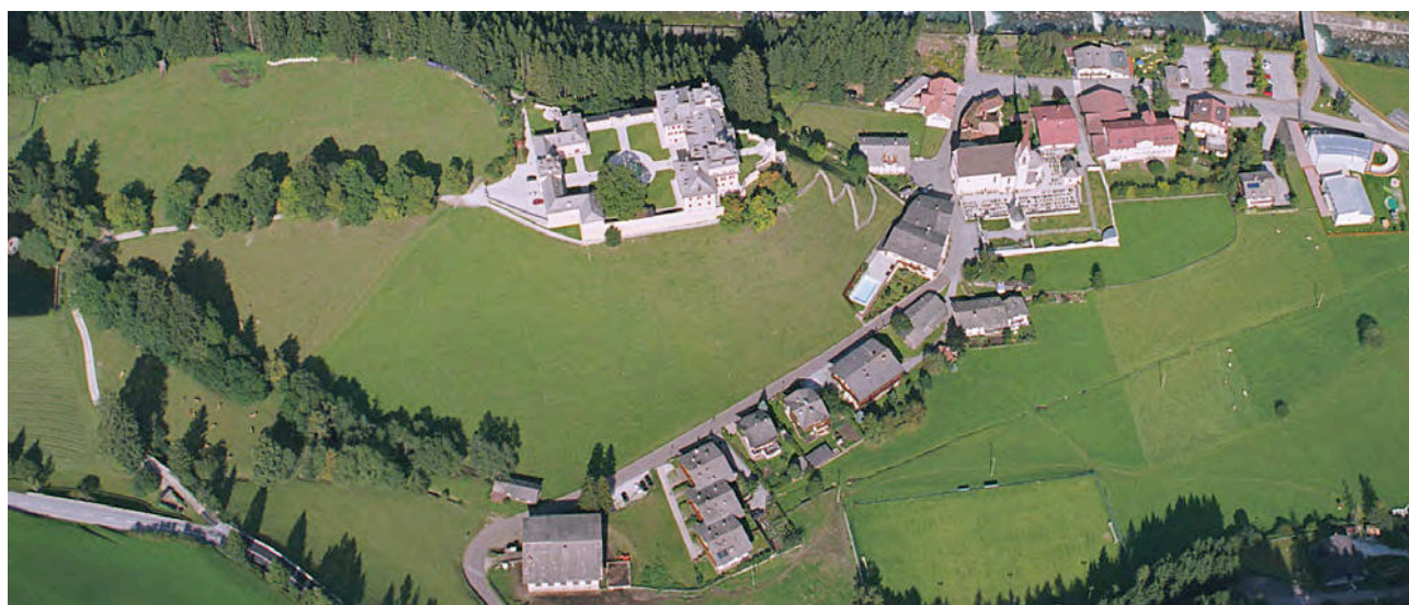
Luftaufnahme – Foto aerea