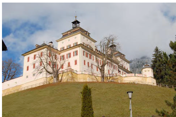
BP-Ped 12/1 +