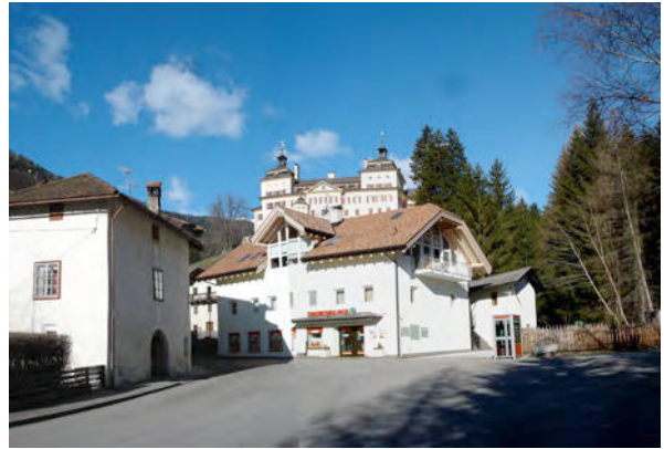
BP Ped 11/2