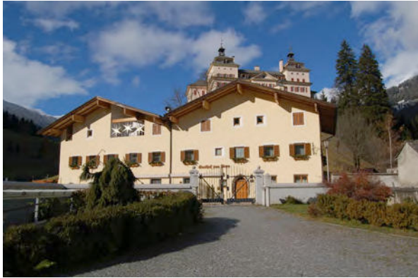
BP Ped 10