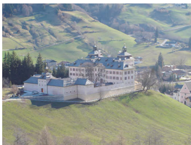
BP-Ped 12/1 +