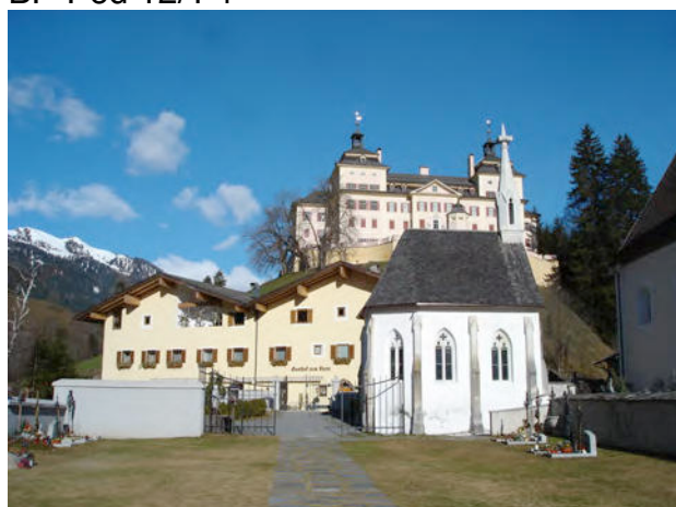
BP Ped 12/1 - 1