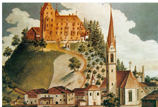
Alte Aquarell vom 1725 – Acquarello del 1725