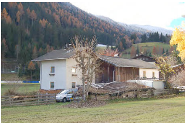
BP Ped 7/1-9/3