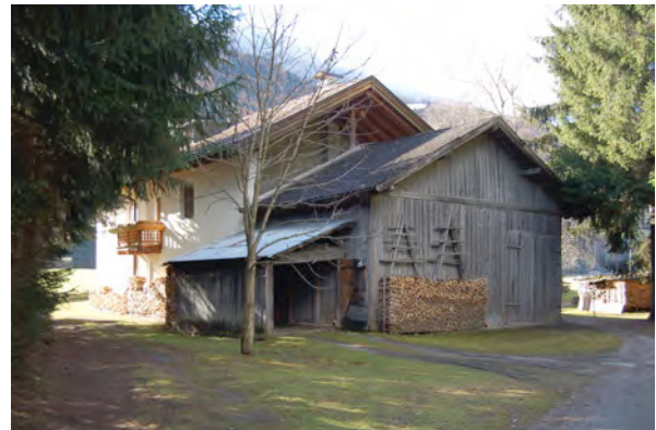
BP Ped 16 Nord