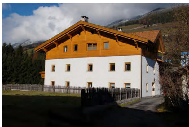
BP Ped 15/2 2009