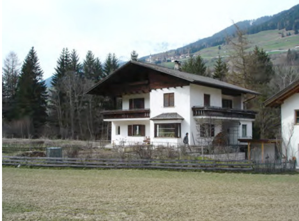
BP Ped 329