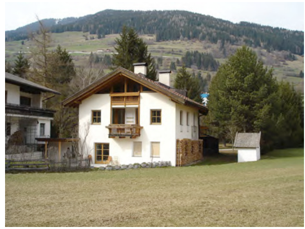
BP Ped 16 SudFassade