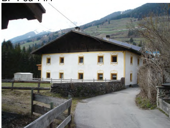
BP Ped 15/2 2006