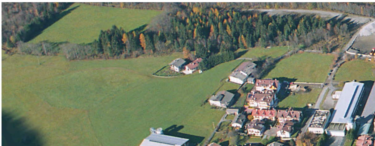
Luftaufnahme – Foto aerea