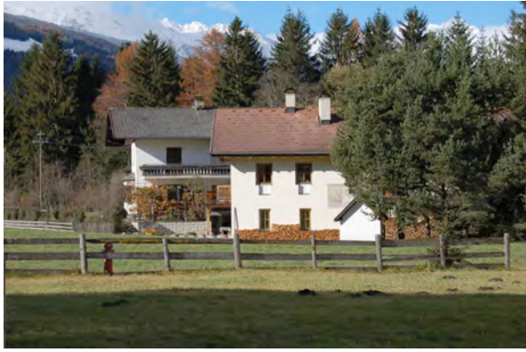
BP Ped 16